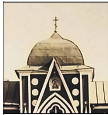
Различия башенной части псарни и богадельни.

не оставили сомнения в принадлежности дома к богадельне, но никак не к псарне.